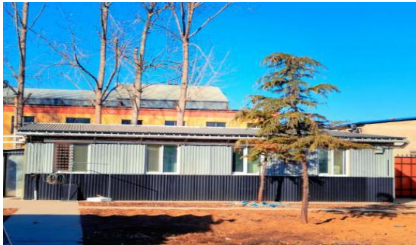
图 1-4 降温得能板应用示意图

东西南三面利用降温得能板做装饰面，达到了降温、隔热、防水的效果，减少夏季空调的使用率，达到建筑节能的效果。