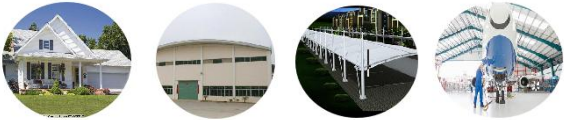
图 1-3 降温得能瓦（板）应用范围示意图